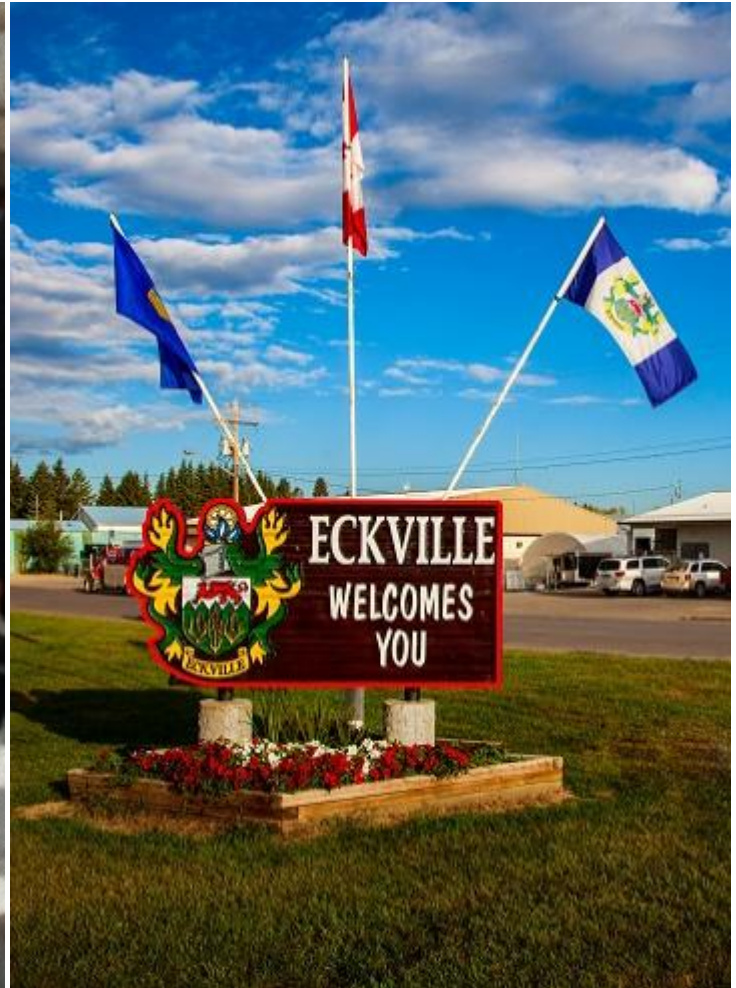
В'їзд в Еквіл