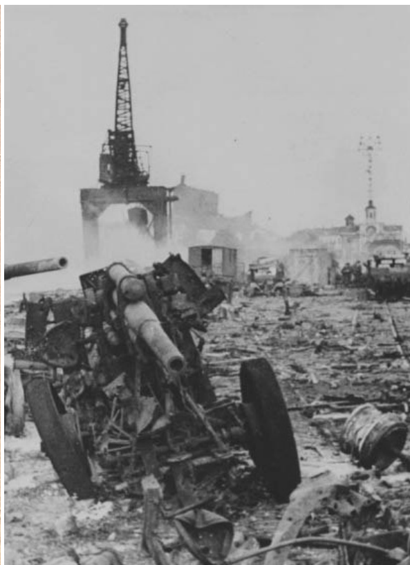
Уничтоженные советские орудия, Одесса, осень 1941 года