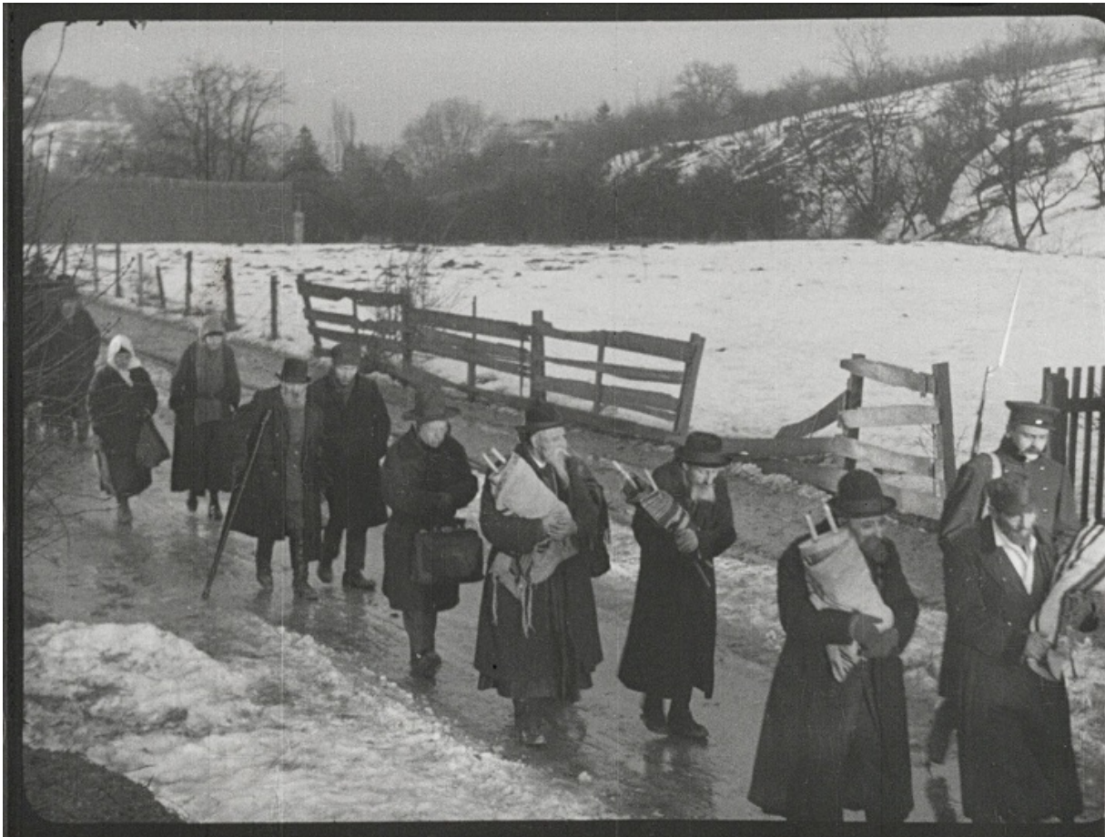
Кадр из фильма «Город без евреев»

Почти сто лет назад — в 1922 году — из-под пера известного австрийского писателя Хуго Беттауэра вышел роман под названием «Город без евреев». Этот сын львовского биржевого маклера в 18 лет оставил иудаизм ради почти несбыточной для еврея мечты — попасть в бригаду горных стрелков и сделать блистательную военную карьеру.